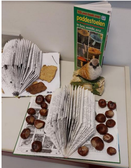
Er worden egeltjes gemaakt van oude boeken.