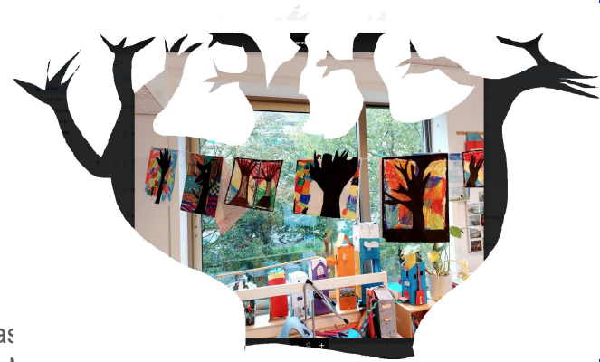
Een bos vol met enge bomen. De achtergrond is kleurrijk met zelf verzonden patronen.

De leerlingen zijn druk bezig de hele klas herfstachtig mooi te versieren. Een boek met wel 200 bladzijden is geen enkel probleem voor deze doorzetters.